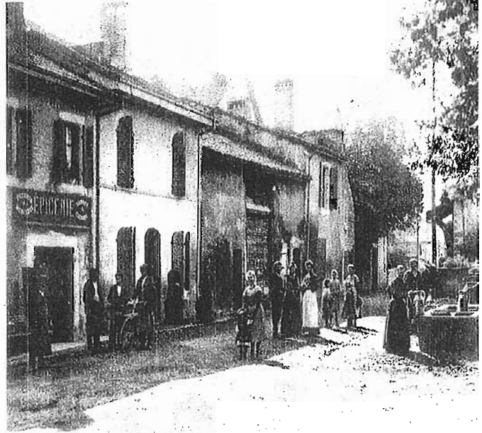
La rue des Molards vers 1900.

L'on peut reconnaître la fontaine et l'ancienne épicerie à l'angle actuel de l'impasse du Puits-Ballant