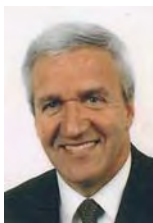
Patrick Simon Municipal