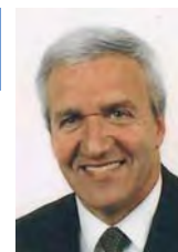
Patrick Simon Municipal

entre les Communes de Mies, de Tannay et les services de l'Etat, de procéder à un éclaircissement d'importance. Ce sont ainsi près de 80 arbres représentant près de 115 m 3 qui ont dû être évacués. Cette opération s'est faite avec des moyens hippiques, afin de sauvegarder la nature et de déranger le moins possible la faune nidificatrice en ce printemps splendide. Des nouveaux travaux de consolidation des berges seront prochainement entrepris dans la partie amont du Torry. P. S.