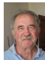
Jacques Kaltentieder Municipal

Toutes ces informations peuvent être consultées sur le site www.canicule.ch . J. K.