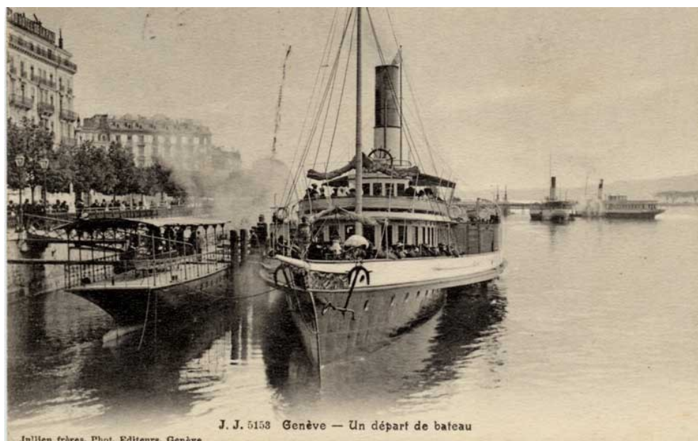
J. J. 5153 Genève — Un départ de bateau