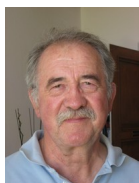
Jacques Kaltentieder Municipal