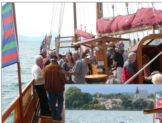
Croisière et repas sur la galère « La Liberté »