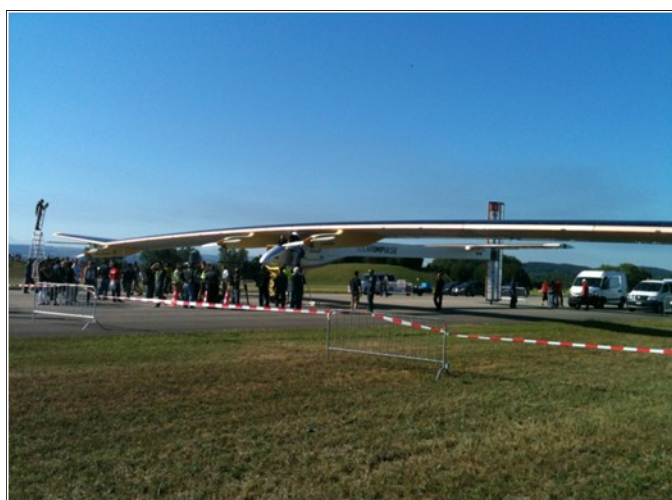
Solar Impulse après l'atterrissage

Bravo à ces pionniers suisses et vaudois, amis de Tannay. Une petite note de chauvinisme est bien méritée.