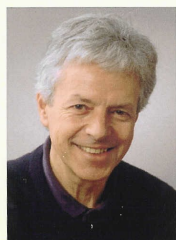
Serge Schmidt Municipal

Chaque année, c'est une petite dizaine de personnes, pour la plupart originaires de l'Union européenne, qui obtiennent à Tannay leur naturalisation. Le plus souvent, ce sont des habitants de notre commune de longue date, très bien intégrés, qui souhaitent s'impliquer davantage encore dans la vie de notre région. En Suisse depuis bien longtemps, ils en connaissent fort bien les institutions et n'imaginent pas quitter notre pays où ils ont planté leurs racines. Leurs enfants, souvent nés en Suisse, y ont fait leurs écoles et se considèrent en tous points semblables à leurs camarades helvétiques.