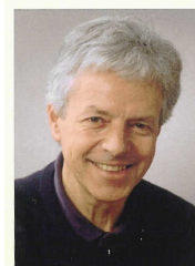
Serge Schmidt Municipal

Une séance d'information ouverte à tous les parents de Terre Sainte qui souhaitent en savoir plus est fixée au 29 janvier 2009 à la grande salle de Tannay au cours de laquelle les responsables répondront à toutes les questions concernant l'organisation du réseau et des structures ainsi qu'à propos des tarifs. (S.Sch.)