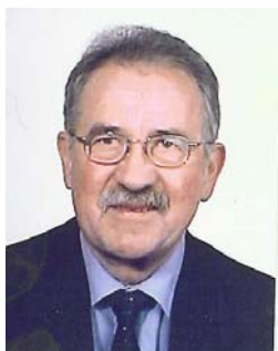
Jacques Kaltenrieder Municipal

Cette année l'Amicale de Tannay organisera son traditionnel concert de jazz sur l'Esplanade du Château avec la participation de l'excellent orchestre VUFFLENS JAZZ BAND, formation très connue en pays vaudois qui s'est déjà produite à Tannay en 2003.