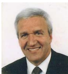
Patrick Simon Municipal

« CONSERVER, EMBELLIR, TRANSMETTRE AUX GÉNÉRATIONS FUTURES LE PATRIMOINE DE NOTRE COMMUNE »