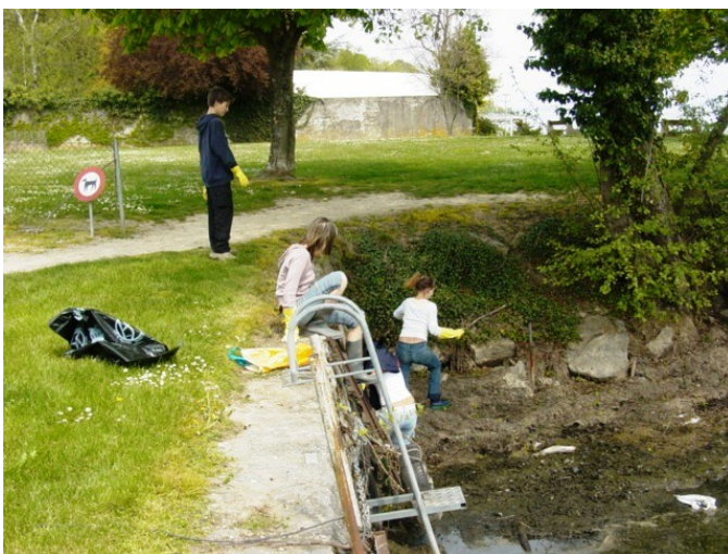
Beurkkk ! C'est pas sympa la vase !