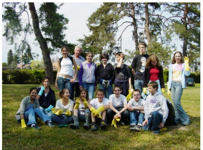
Le travail est fini ! Photo de groupe dans la bonne humeur !