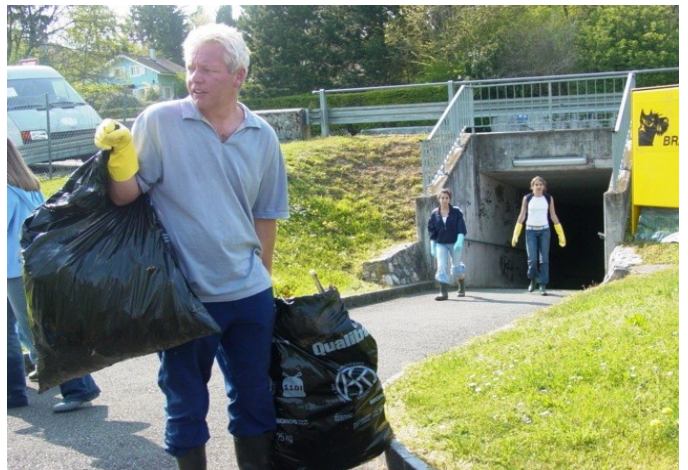
Même le professeur est de la partie... mais pourquoi est-ce que les gens jettent tout par terre ? ont-ils du plaisir à salir ?