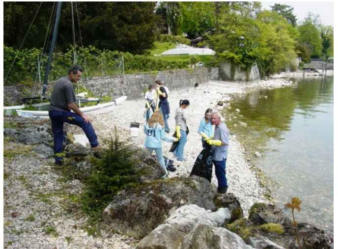
Les moules du lac...ça se mange ?