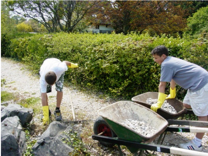
On bouche avec les galets et le sable du lac et surtout de l'huile de coude !

On fait beaucoup de choses en un après-midi, nettoyer, les rives les chemins de la Berieux, de la Petite-Rive, le lit du Torry, le port et tout cela avec le sourire !