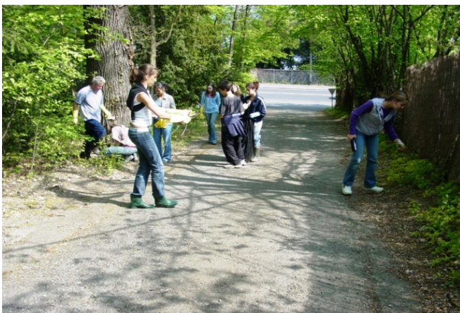
Chemin de la Berieux : on traque le plus petit déchet !