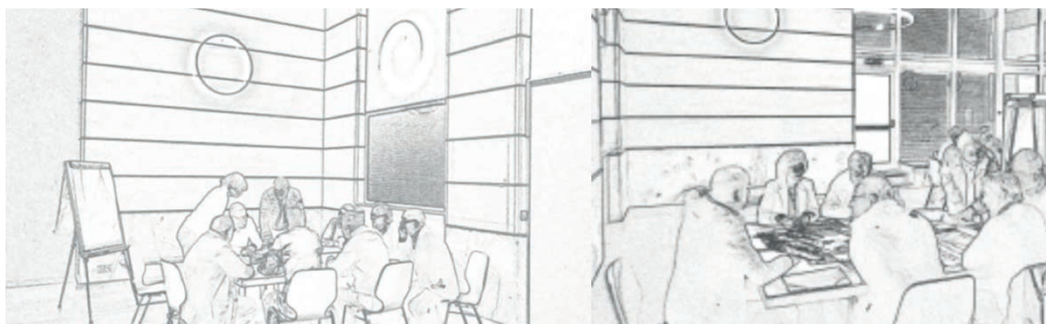
Atelier de travail avec les habitants à la salle communale (dessins : PLAREL SA – architectes et urbanistes associés)

Ces thèmes sont actuellement pris en considération dans différents projets sur lesquels travaille la Municipalité. Ils ont également trouvé un écho dans les dernières modifications du PACom.