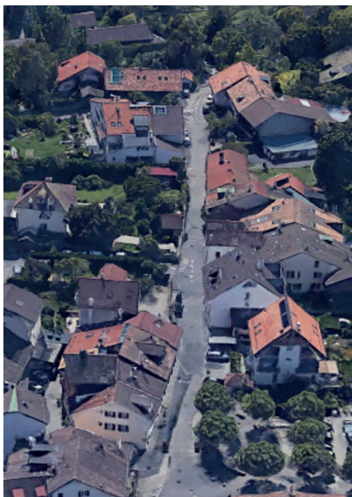
Quel aménagement pour le centre historique de Tannay ?