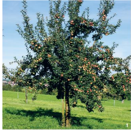
A gauche, verger ; à droite, arbre fruitier haute tige