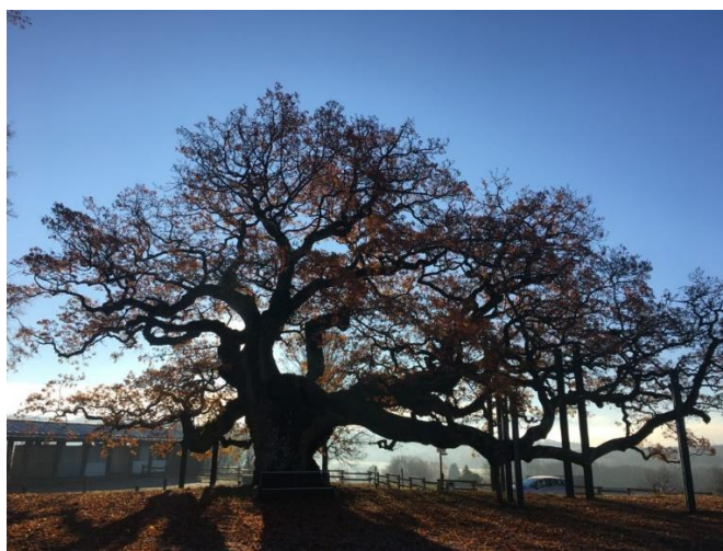
A gauche, arbre isolé ; à droite : arbre remarquable (chêne de Morrens)