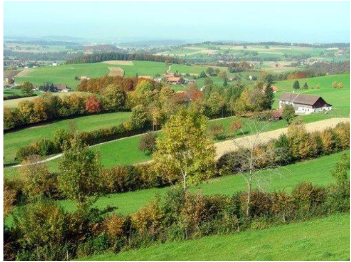
A gauche, allée d'arbres ; à droite, haies