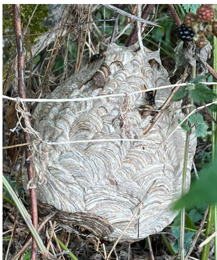
Figure 4 Nid primaire, Céligny, août 2023

A la fin de l'été, les colonies de frelons asiatique se développent et peuvent migrer à des dizaines de mètres de hauteur et construire un nid énorme dans un arbre. Les premiers nids peuvent aussi rester en place et donnent lieu à des constructions gigantesques.