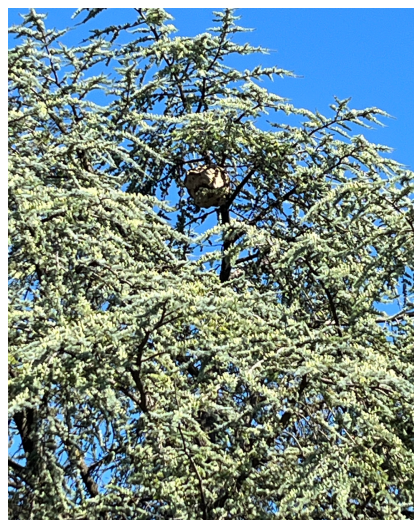
Figure 3: Nid secondaire, Prangins, septembre 23

A la fin de l'été, les colonies de frelons asiatique se développent et peuvent migrer à des dizaines de mètres de hauteur et construire un nid énorme dans un arbre. Les premiers nids peuvent aussi rester en place et donnent lieu à des constructions gigantesques.