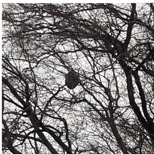
Figure 5: nid visible une fois les feuilles de arbres tombées, Genève, novembre 2023

Ces nids ne se voient pas et ne se trouvent pas facilement. Ils contiennent des milliers d'individus et peuvent générer des centaines de reines pour l'année suivante. Ils sont en forme de poire avec les bords nets (ne pas confondre avec les boules de gui ou les nids de corvidés).