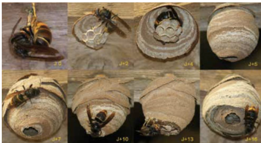
Figure 2: premiers stades de la construction du nid (printemps)

Les jeunes reines hivernent seules à l'abri et sont très résistantes. Au printemps (environ mars), elles construisent un premier nid. Ces nids peuvent être détruits facilement car ils sont petits et souvent accessible, car proche du sol. Ils peuvent être sous un avant-toit, dans une cabane de jardin, dans une haie ou un buisson, tous les cas de figure sont possibles.